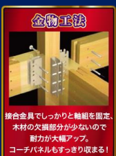
金物工法 接合金具でしっかりと軸組を固定。木材の欠損部分が少ないので耐力が大幅アップ。コーチパネルもすっきり収まる！