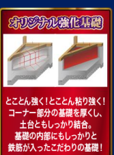
オリジナル強化基礎 とことん強く！とことん粘り強く！ コーチ部分の基礎を厚くし、土台もしっかり結合。基礎の内部もしっかりと鉄筋が入ったこだわりの基礎！