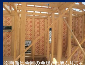
※画像は今回の会場とは異なります。